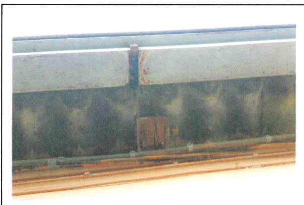
Abitazioni - dettaglio copertura di cemento amianto