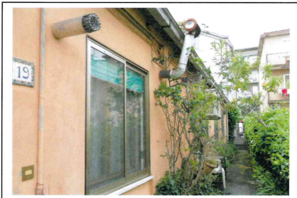
Abitazioni - copertura di cemento amianto