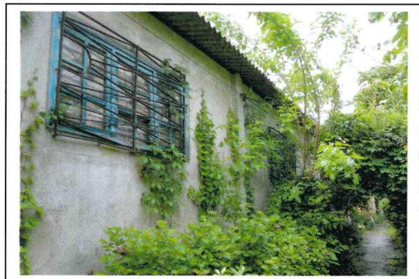
Magazzino - copertura di cemento amianto