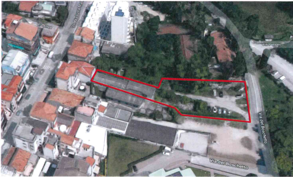
Vista aerea con identificazione del lotto oggetto di intervento